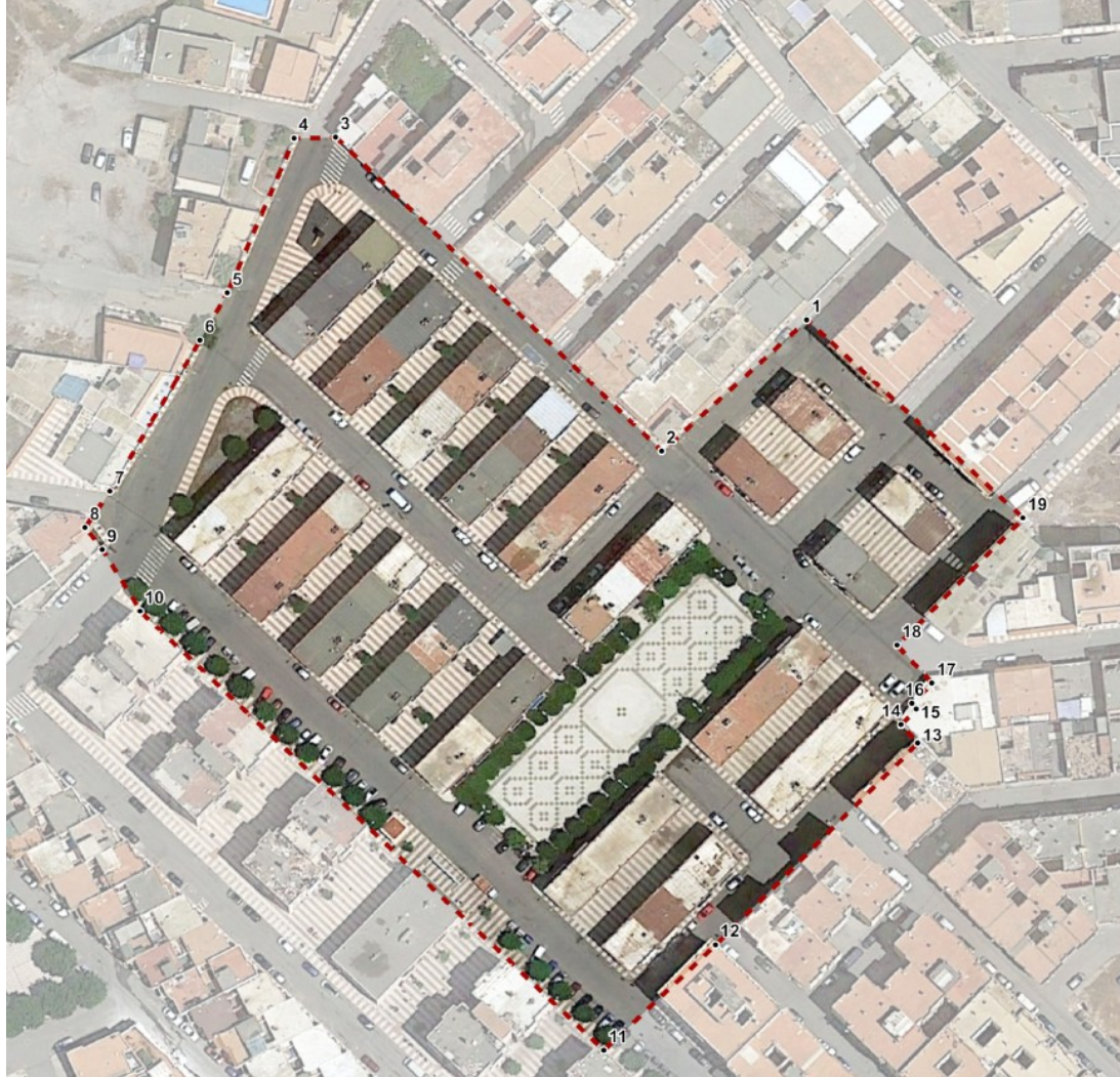
Coordenadas UTM ETRS89 Huso 30