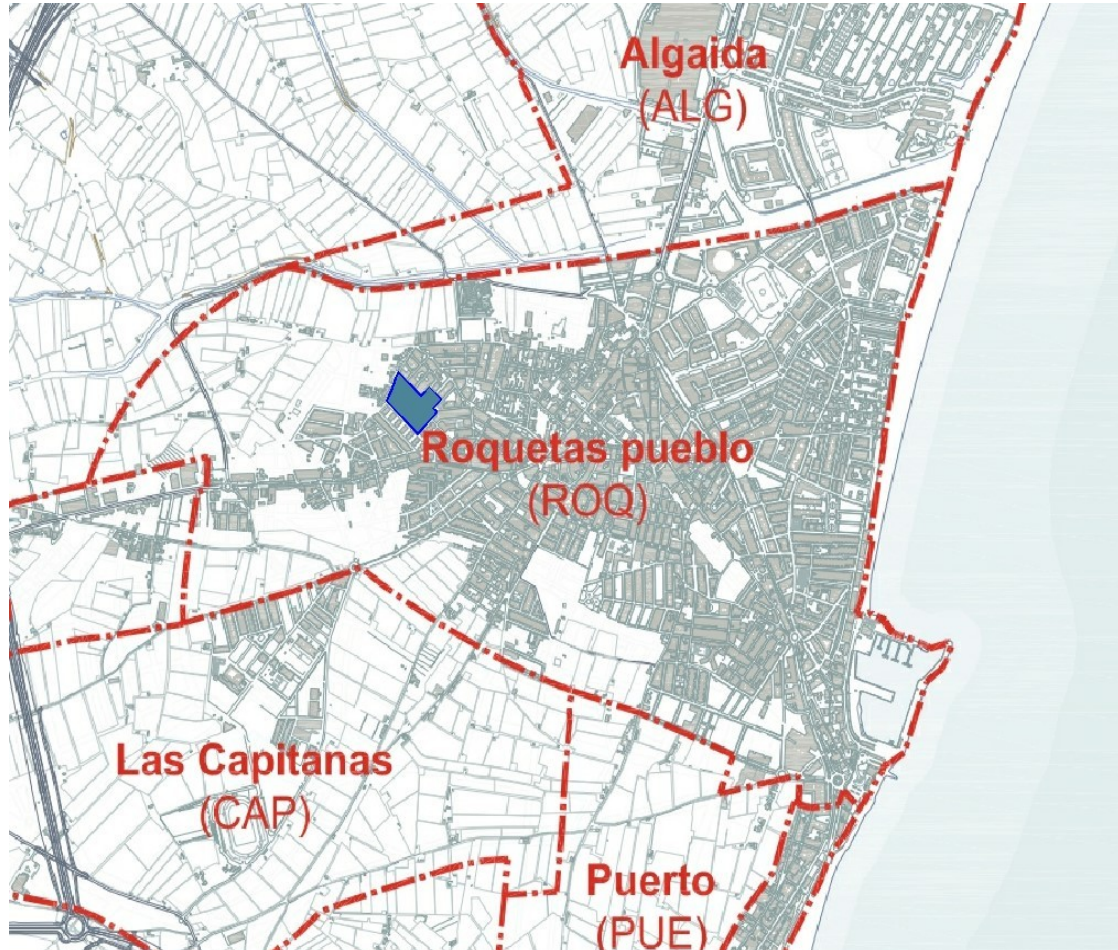
Imagen 2: Plano de la emplazamiento del ERRP.

Los inmuebles y superficies que se proponen como ámbito de actuación son los pertenecientes a esta zona del núcleo urbano más antiguo y debilitado desde un punto de vista constructivo y, en consecuencia, energéticamente.