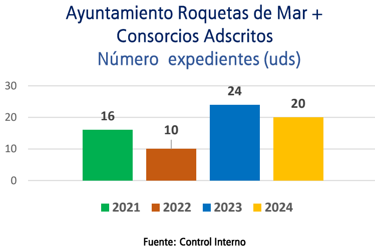
Gráfico 1: Clasificación por número expedientes Informes de Omisión de Función Interventora del Ayuntamiento de Roquetas de Mar y sus consorcios adscritos.