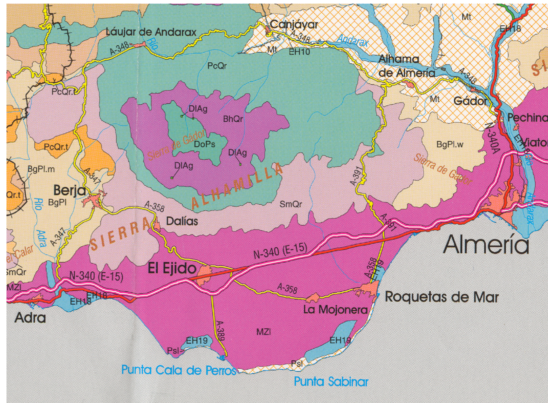
MAPA DE SERIES DE VEGETACIÓN DE ANDALUCÍA ORIENTAL.