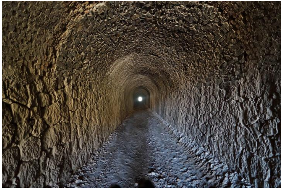
Túnel del Servalico.

Salimos del túnel y encontramos un cruce en el que seguiremos recto. A este cruce llegaremos luego a la vuelta, por el camino que ahora está a nuestra derecha. Continuamos por el camino que tiene el típico trazado de un ferrocarril, poco desnivel y curvas suaves. Pasamos junto a un edificio a nuestra derecha que era la cochera de la locomotora. Un poco más adelante, unos metros a nuestra derecha y oculta entre la vegetación, está la entrada a la mina de la Higuera.