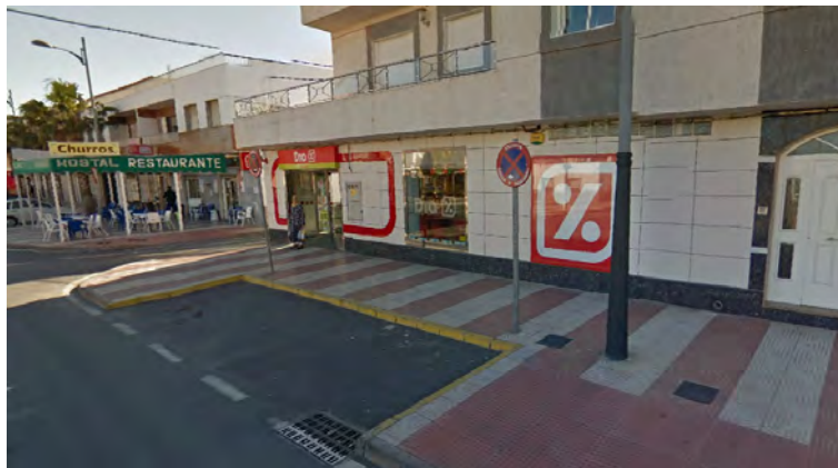
IMAGEN 28. Zona reservada de carga y descarga en la Avd. Las Marinas

En el municipio de Roquetas de Mar existen un total de 104 zonas de espacio reservado; generalmente se trata de zonas de aparcamiento en línea convenientemente señalizadas (con señalización vertical y horizontal) y reservadas para las operaciones de carga y descarga de los vehículos comerciales.