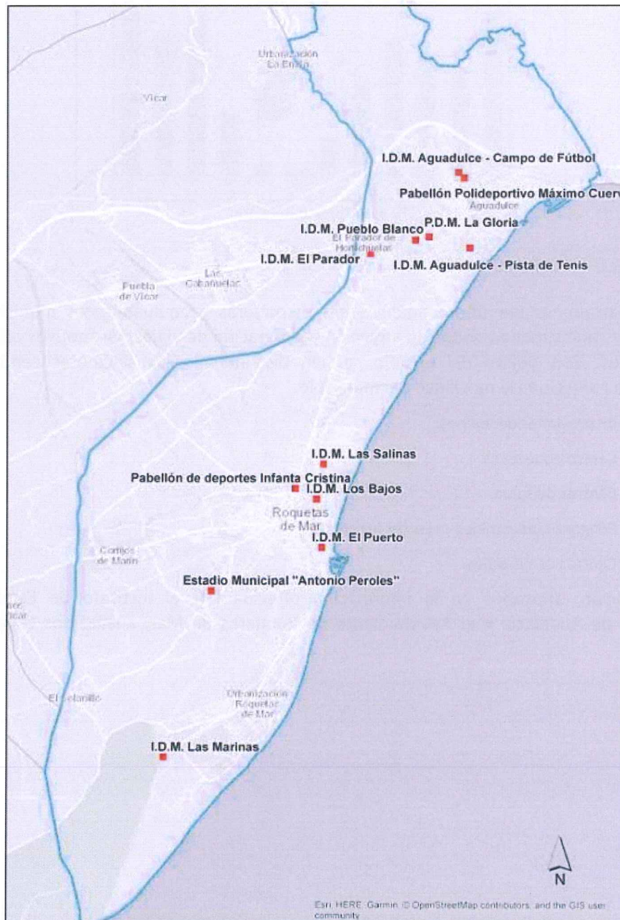
INSTALACIONES DEPORTIVAS EN ROQUETAS DE MAR