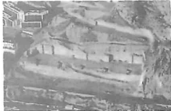
Fotografías del desmonte de las parcelas R1 y R2 del Sector 1 del PGOU: donde se aprecian las modificaciones y dichas "cicatrices" que ésta ordenanza hubiese permitido evitar.

Con el desarrollo técnico-jurídico de ésta futura ordenanza; ya hemos dejado claro que si bien no podemos actuar con carácter retroactivo; evitaremos en futuro próximo éstos desmanes y heridas al paisaje; como la agresión y "atentado" al territorio que junto con éste ejemplo anterior de los "acantilados de Aguadulce"; suponen las parcelas R3 y R1 del Sector 4, ubicado en Aguadulce Norte en la zona conocida como "Las Colinas de Aguadulce", parcelas anexas a "La Vaguada" (Parcela R2).